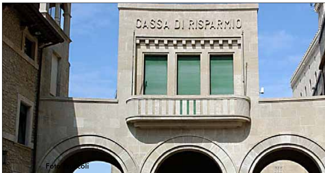
a pagina 3

All'orizzonte il rinnovo del Cda e la ricapitalizzazione da 150 milioni