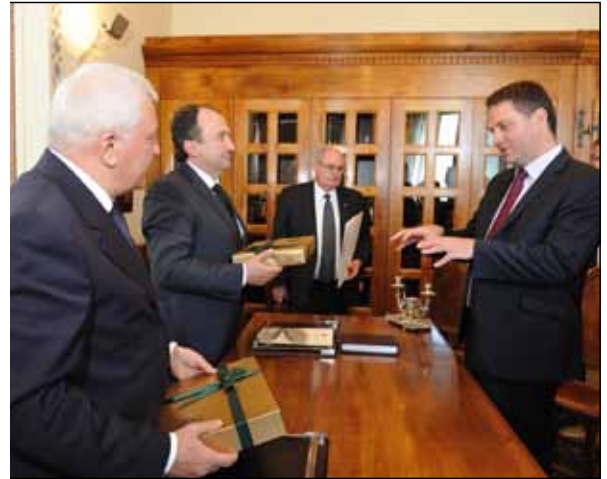
Due momenti della visita della delegazione australiana sul Titano

segretari di Stato agli Esteri, alle Finanze e all'Industria. "Nel corso dei colloqui - spiega una nota del governo - si sono approfonditi temi di comune interesse, in particolare l'intensificazione del rapporto bilaterale sui temi